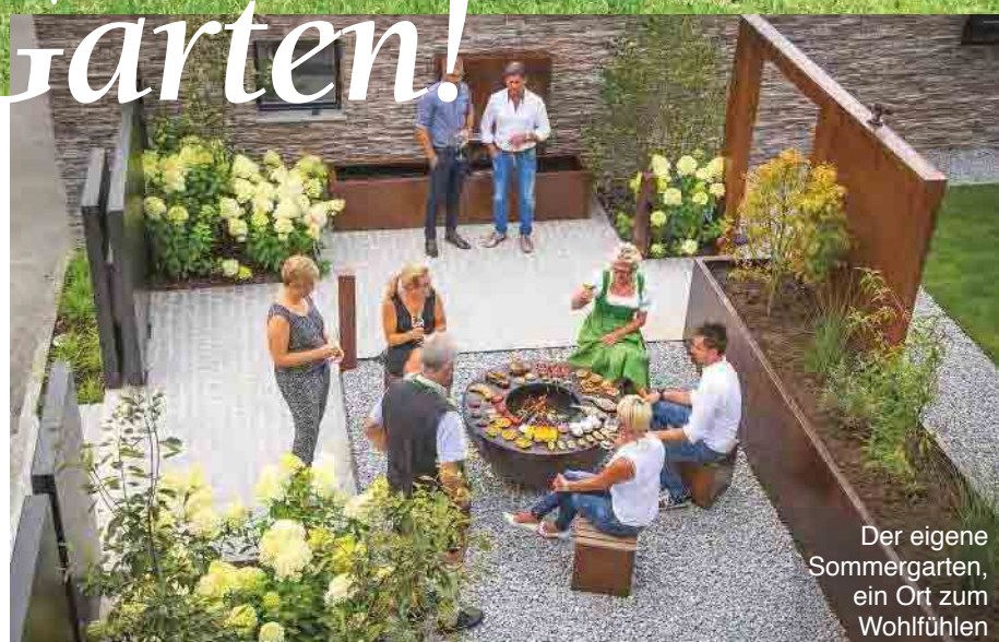
Der eigene Sommergarten, ein Ort zum Wohlfühlen

Als Hauptakteur im Garten kann unsere formschöne Grillschale aus Cortenstahl fungieren, die als Feuerschale oder einfach als Grill verwendet werden kann. Unser mannigfaltiges