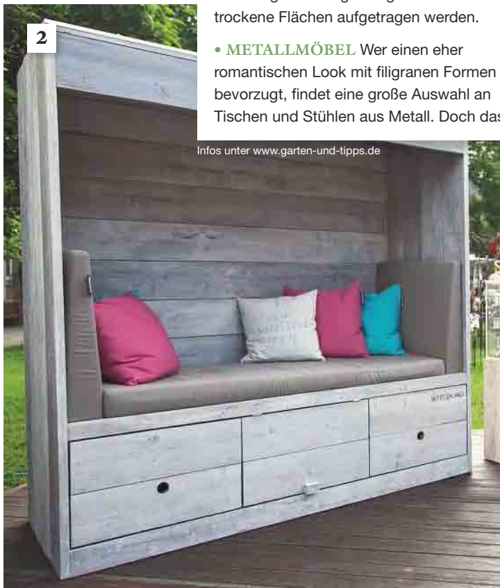
Infos unter www.garten-und-tipps.de