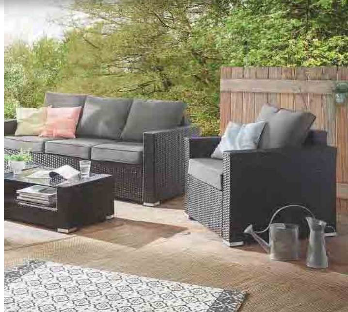
1 HARMONISCH Set „Chatto“ kommt inklusive Tisch und Kissen (ca. 3.900 Euro, Neptune). 2 LAUSCHIG In der „Lounge Koje“ kann man es sich auch zu zweit gemütlich machen (200 x 200 x 80cm, ab ca. 2.500 Euro, Wittekind). 3 PARADIESISCH Mit dem Gartenmöbelset „Jalta“ fühlt man sich im eigenen Grünen wie im Urlaub (ca. 1.300 Euro, Massivum).